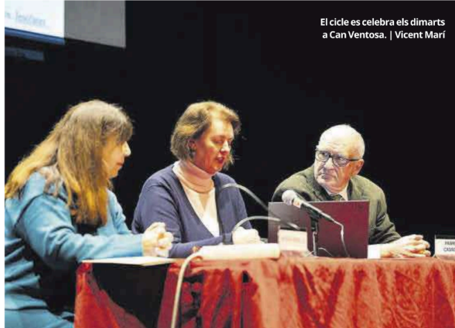
El cicle es celebra els dimarts a Can Ventosa. | Vicent Mari

— Sí, perquè, de fet, Plató a 'La República' el que proposa és una mena de barreja: un filòsof, però que, d'alguna forma, té el beneplacit dels déus per governar. I això també es veu molt bé al mite de la Caverna de Plató. Què