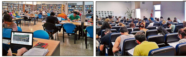
Cada vez son más los jóvenes, más de un 10% en la actualidad, que al término de sus estudios secundarios apuestan por la universidad a distancia.