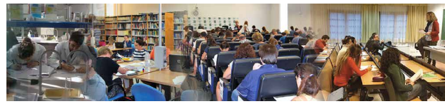
Matrícula abierta en UNED - Illes Balears