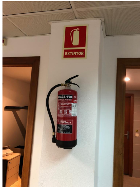
Foto 6A: Extintor existente, con la pegatina de la empresa mantenedora.