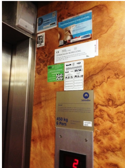
Foto 8: Ascensor con pegatina de Organismo de Control, con fecha de las inspecciones.