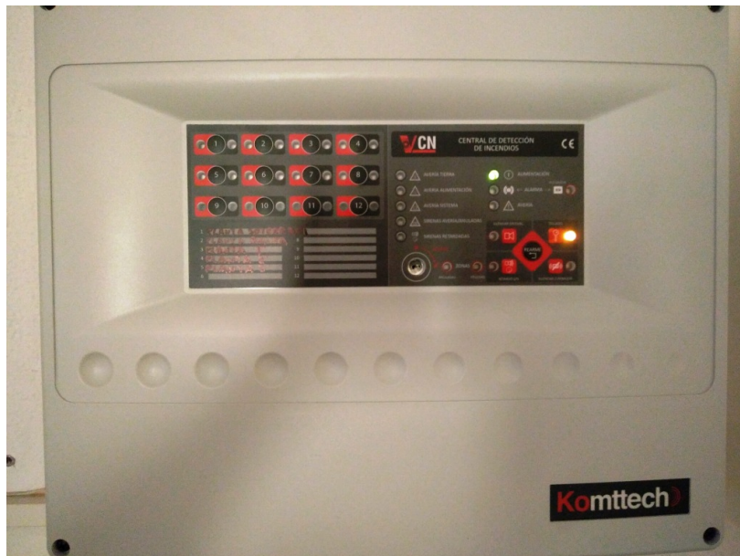
Foto 3: Centralita de alarma de incendios, general de todo el edificio, situada en planta baja.