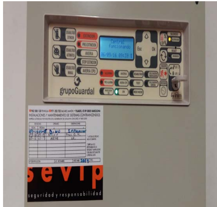
Foto 3: Centralita de alarma de incendios, con la pegatina de la empresa mantenedora.