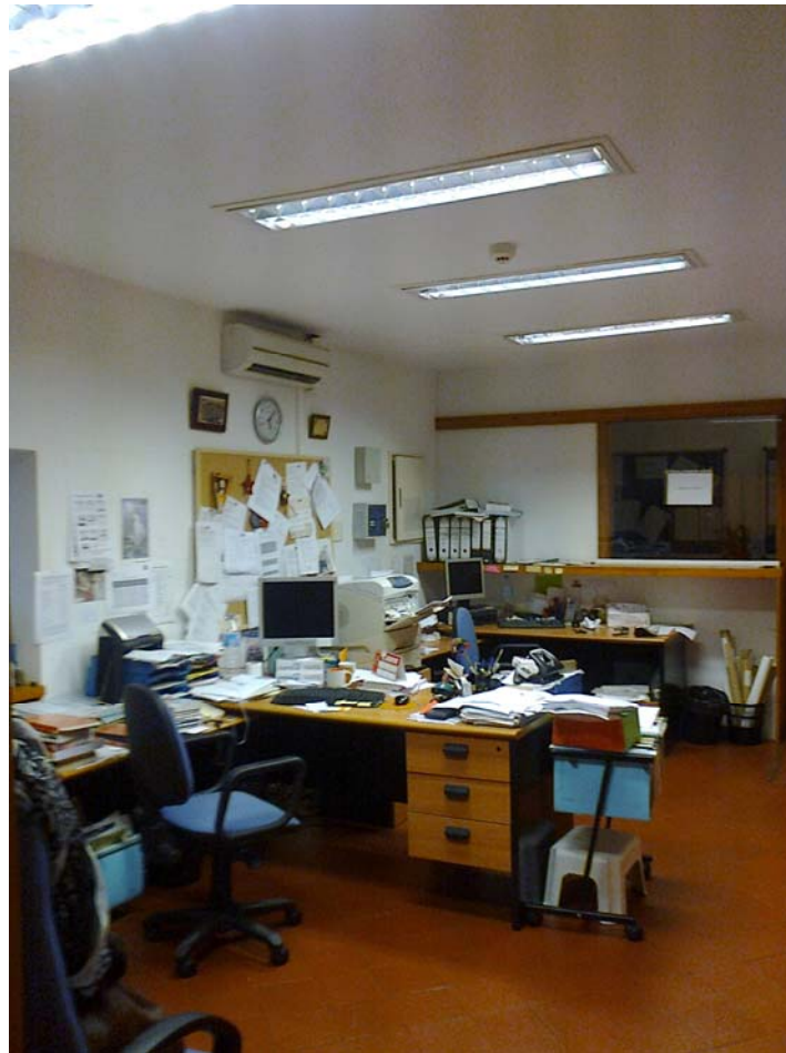
Foto 5: Secretaría donde se pueden observar los puestos de trabajo y material de oficina.