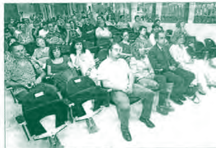
El público asistente, minutos antes del acto. M.C.

grados, además de otros cursos como el de acceso a la universidad para mayores de 25 años. Los estudios más demandados en la isla son los de Psicología, Derecho, Administración y Dirección de Empresas, Historia, Historia del Arte y Estudios Ingleses.