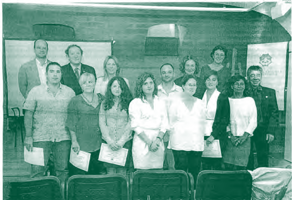
SEDE DEL IME. En el transcurso del acto inaugural de la UNED se hizo entrega a nueve titulados de su diploma como graduados

El estudiante que se incorpora a la UNED tiene unos perfiles muy bien definidos. Procede principalmente del curso de acceso a la universidad para mayores de 25 años, se traga de personas que abandonaron sus estudios de Secundaria y ahora desean progresar en el trabajo o encontrar uno de nuevo de mayor calificación. También es significativo el grupo de personas que se incorporan con estudios universitarios iniciados, incluso finalizados, que encuentran en la UNED la posibilidad de compaginar esta