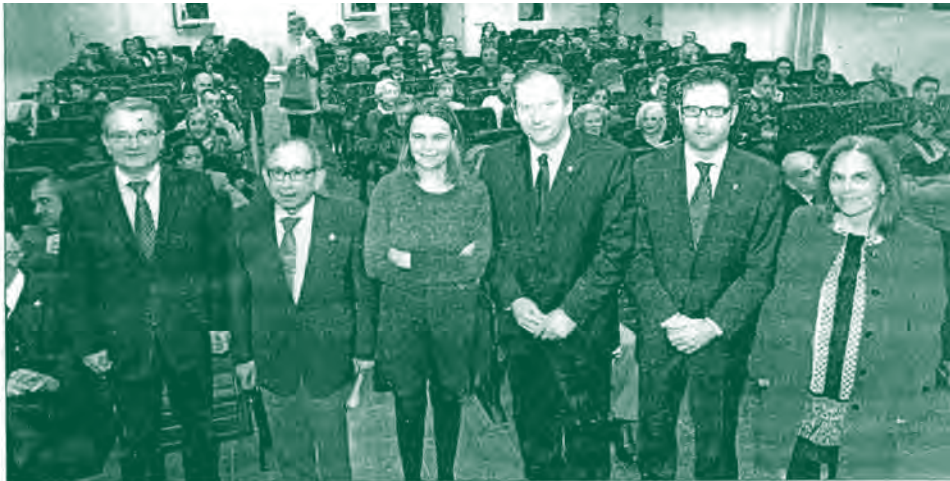
Un momento de la celebración del 35 aniversario de la UNED en Baleares ayer.