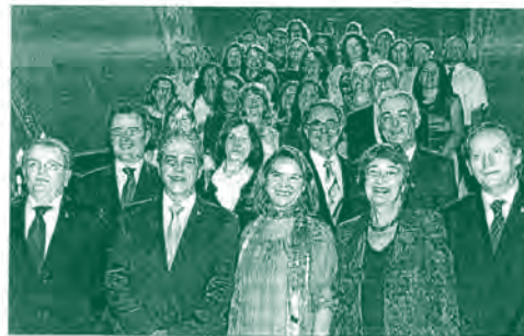
Las autoridades posaron con los titulados por la UNED.