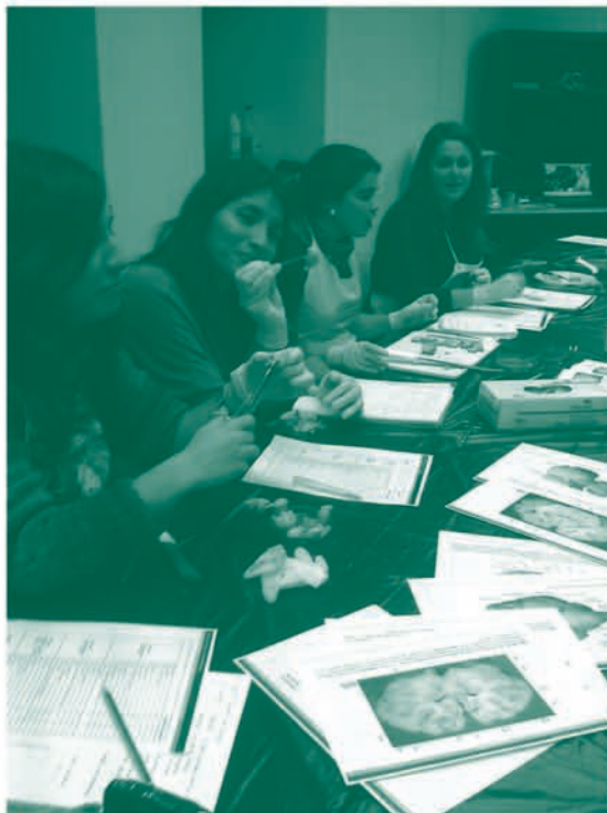
Estudiantes de Psicología de Menorca realizando prácticas en la sede del centro en Maó.