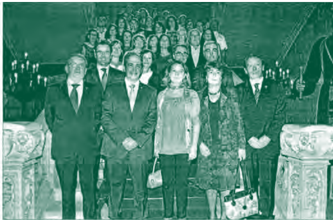
Un momento de la presentación del curso de la UNED, ayer en el Consell de Mallorca.