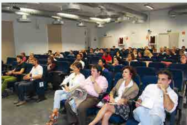
Jornada de Bienvenida al curso académico 2016-2017 en la sede de Palma.