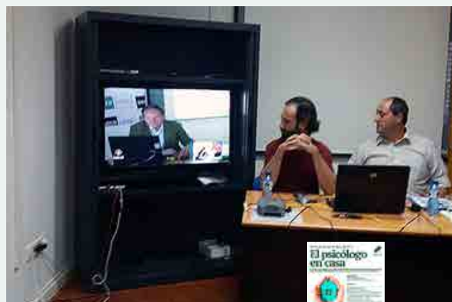
Curso de extensión universitaria, El psicólogo en casa , desde la sede de Menorca.