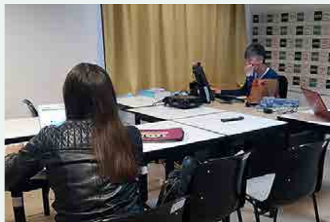
Tutelaje de matrícula para el curso 2016-17, en la sede de Eivissa.