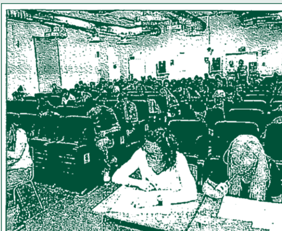
Exámenes de la UNED. Medio millar de alumnos de la UNED participaron ayer los en los exámenes de acceso a la universidad en Balears.

Los estudiantes de la UNED en Mallorca de grado, másters y curso de acceso a la universidad están convocados a desarrollar las pruebas presenciales obligatorias hasta el 10 de febrero. Está previsto que se desarrollen en Palma más de 8.000 pruebas.