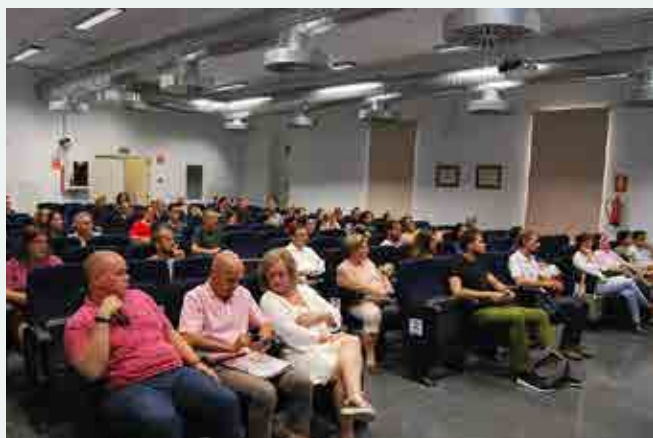
Jornada de Bienvenida al curso académico 2016-2017 en la sede de Palma.