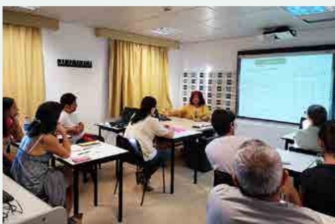
Jornada informativa para nuevos estudiantes, curso académico 2016-17, en la sede de Eivissa.