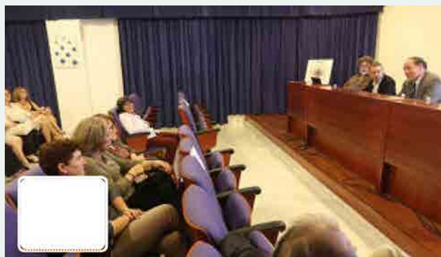
Un momento del acto inaugural del curso 20162017.

Este curso se han incorporado dos nuevos equipamientos, un equipo de videoconferencia digital y otro de webconferencia que permiten la transmisión simultánea de las clases por Internet para que los estudiantes puedan seguirlas en directo desde cualquier dispositivo o verlas después.