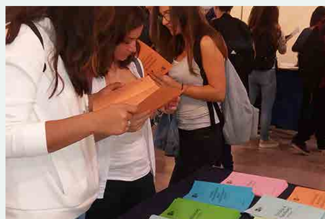
Stand del Centro Asociado en la III Feria de la Enseñanza Universitaria celebrado en Menorca.